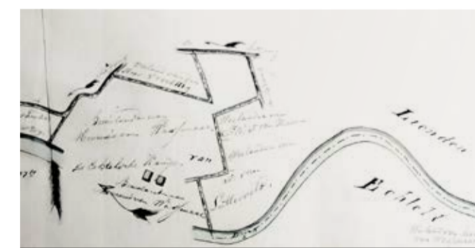
Het land van kasteel De Wyenburg. De kaart dateert uit 1824.

"Ik ben blijven verzamelen. En nu ben ik me echt weer op alle onderwerpen aan het inlezen, dingen aan het opzoeken en gesprekken aan het voeren. In het nieuwe boek gaan de ontwikkelingen van veel onderwerpen langskomen. Natuurlijk alle ontwikkelingen rond de legalisatie, de afbouw van de woonwijk, het steeds groter wordende Lingemeer,