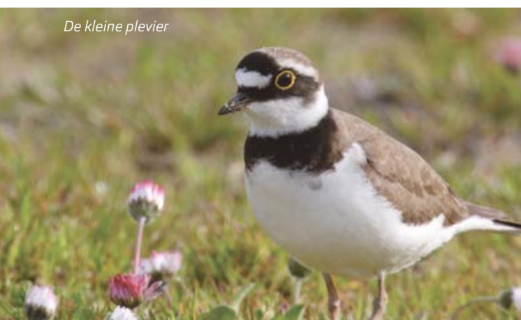
De kleine plevier

Een klein deel van de percelen is op dit moment nog agrarisch in gebruik. Daarvan voeren we komend jaar de bovengrond en klei af. Ook is dit jaar de beplanting ingeplant aan de oevers ter hoogte van de Bloembosweg en de Ommerenveldseweg en zijn de oevers afgewerkt. We streven ernaar om de kleiwinning in de Blauwe Kampse Plas in de loop van 2019 af te ronden. Naar verwachting kan er eind volgend jaar, zodra de laatste klei is afgevoerd, ook gevaren worden op delen van de Blauwe Kampse Plas. Zodra dit mogelijk is, informeren wij u hierover.