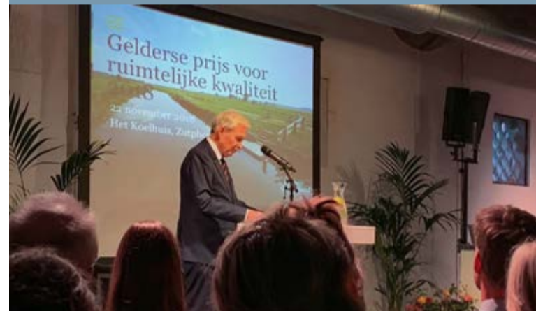
Juryvoorzitter Jan Terlouw aan het woord tijdens de prijsuitreiking

De Gelderse prijs voor ruimtelijke kwaliteit wordt eens in de twee jaar uitgereikt door de provincie Gelderland aan opvallende en inspirerende ruimtelijke projecten. Deze editie was het thema 'Landschap nieuwe stijl'. Daarbij gaat het om landschappen die een opmerkelijke transformatie (hebben) ondergaan. De Lingemeren is daarvan volgens de provincie een goed voorbeeld. Er was een juryprijs en een publieksprijs te winnen van beide € 10.000,-. Het bedrag is bestemd voor het genomineerde gebied.