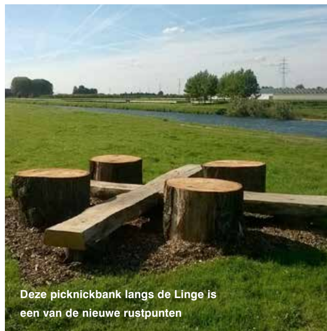
Deze picknickbank langs de Linge is een van de nieuwe rustpunten